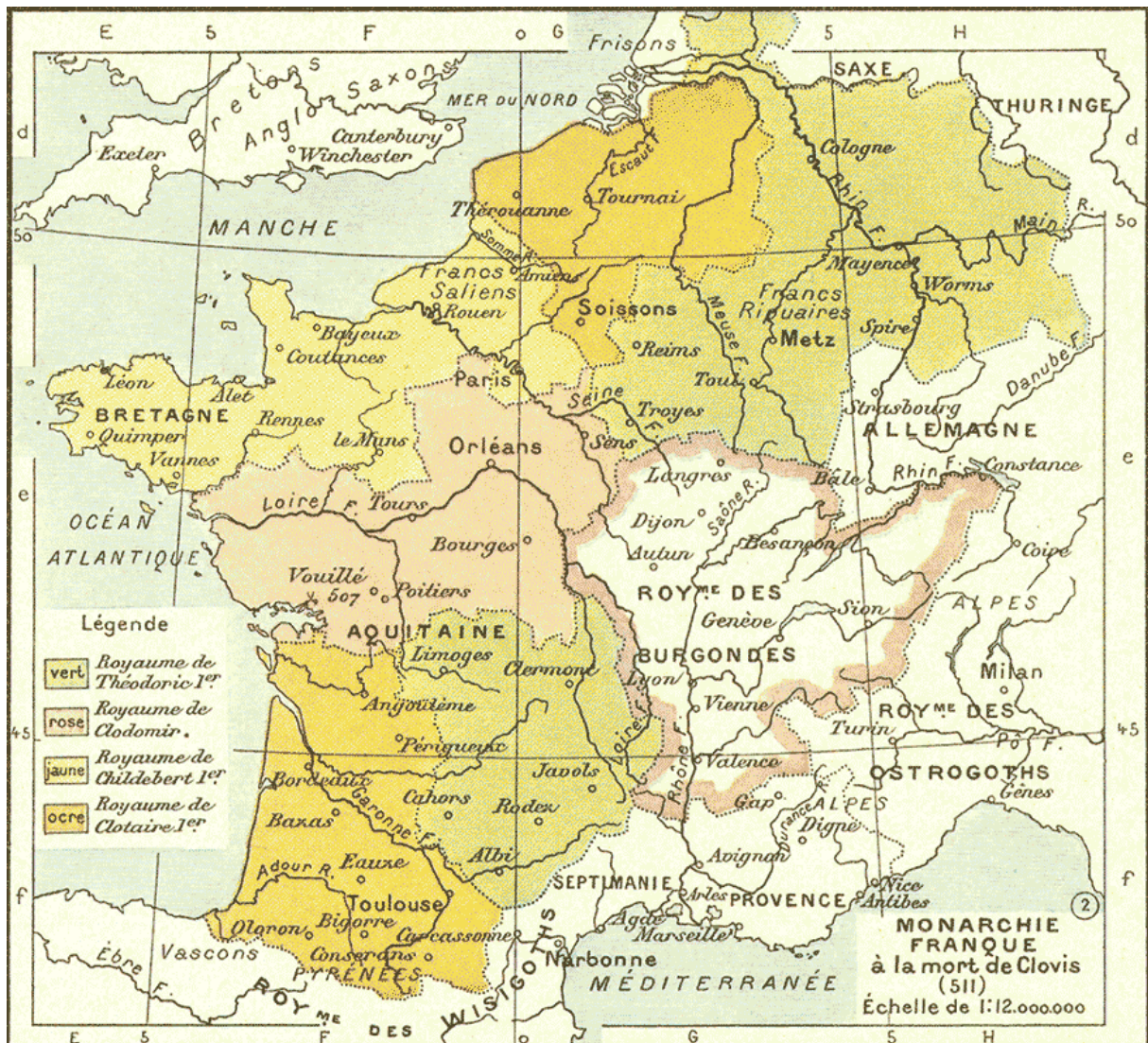
Le royaume Franc à la mort de Clovis en 511.

Néanmoins, le royaume est dépecé et le système du partage va se poursuivre au cours des siècles.