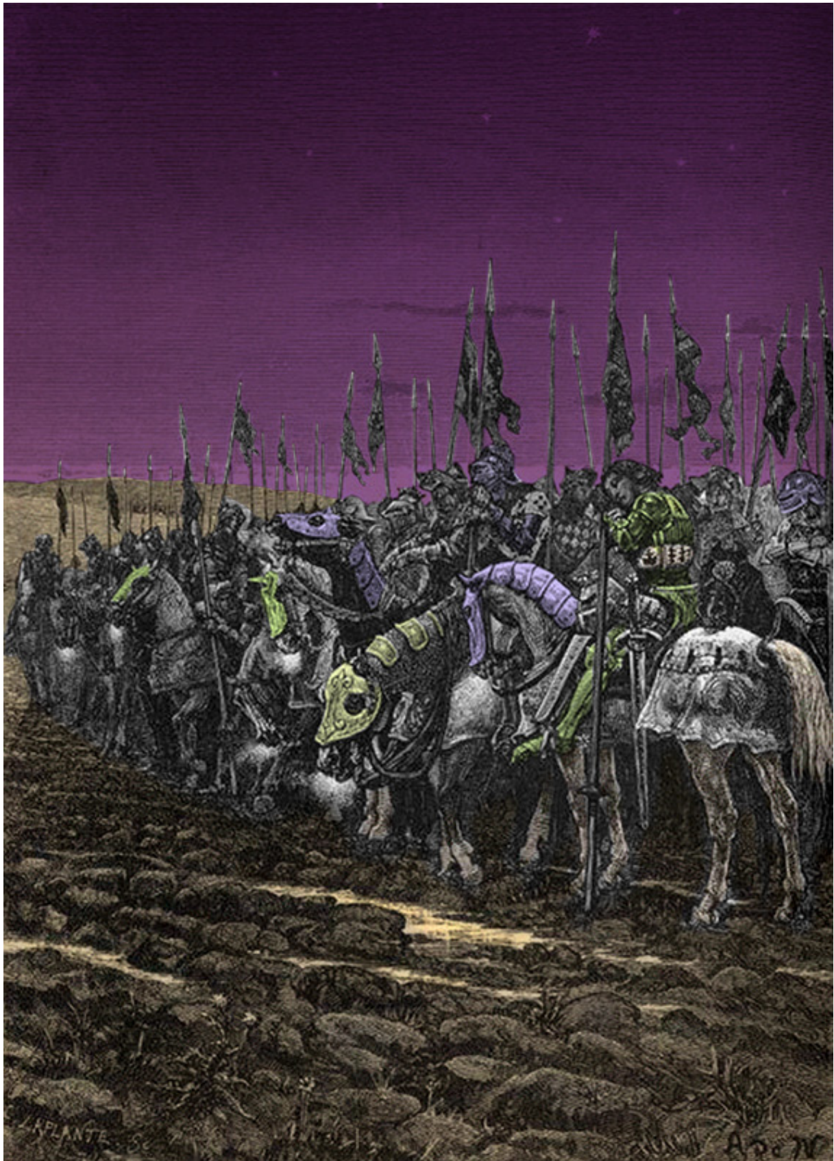
Nuit de 24 Octobre 1415, les chevaliers français se reposent avant la bataille d'Azincourt.

On voit en outre reprendre les hostilités entre la France et l'Angleterre. Les Bourguignons collaborent avec les Anglais.